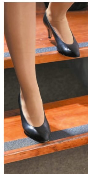
Safety Walk®. Uso General