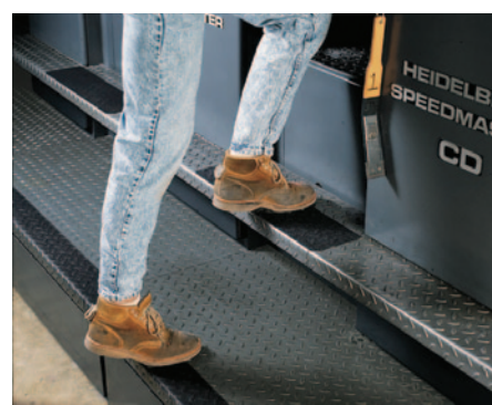
Safety Walk®. Conformable