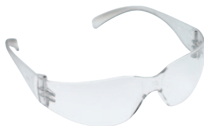
11228-00000-100 SIN RECUBRIMIENTO