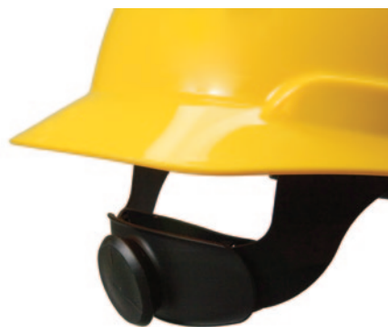
Suspensión tipo Matraca

Los cascos de la serie H-700 unen el confort, estabilidad, balance y protección en un mismo producto; está fabricado en polietileno moldeado de alta densidad y certificado bajo la norma ANSI Z89.1-2009 con la clasificación Tipo 1, Clase C, G y E para la protección de impactos y arcos eléctricos (casco dieléctrico).