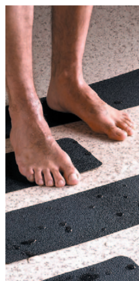
Safety Walk®. Resiliente Medio