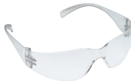
11329-00000-100 CON CAPA ANTIEMPAÑANTE